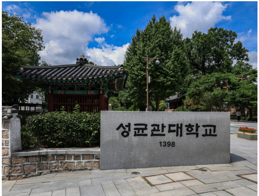
▲ 정문 표지석, (사진= 성균관대학교 S-갤러리)

이어 “우선 2026년 2학기 중앙동아리 재등록 절차 전까지 한 학기 동안 동아리방 유지 자격을 요청하는