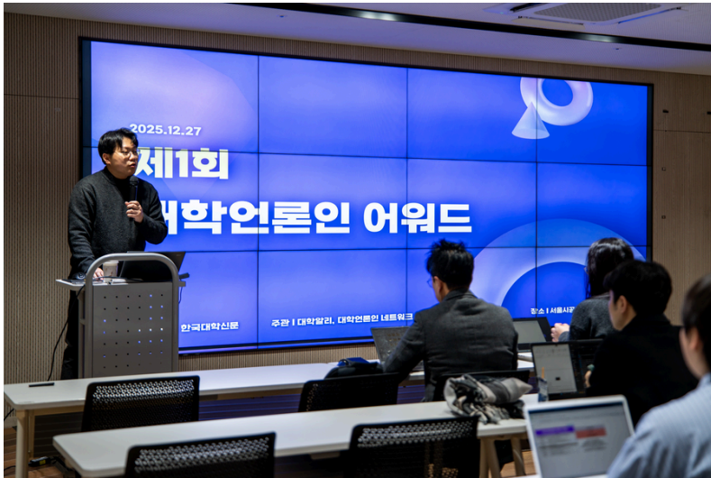
▲제1회 대학언론인 어워드

이러한 구조적 검열은 학생기자의 표현의 자유를 제한하고, 대학의 감시 기능을 상실케 하며, 우리들의 공론장을 축소시킨다. 대학언론인네트워크와 대학알리가 준비한 이번 프로젝트는 바로 이 '좌초된 목소리'들을 다시 수면 위로 끌어올리기 위해 시작되었다.