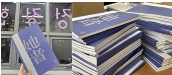
▲ 정정헌 46호 『타자』

* 본 기사는 성균지 113호 『잔상』에 게재되지 못한 기사 「학생-자치-기구, 위기의 스펙트럼 속 우리 대학의 좌표」를 참고했다. 해당 기사는 교지 발간 전 학생처와의 의견 조율 과정에서 '학내 타 단체와의 갈등 우려'를 이유로 제외되었다. 본보는 미발행 기사가 다룬 성균관대 여성주의 교지편집위원회 '정정헌'의 이야기를 취재했다.