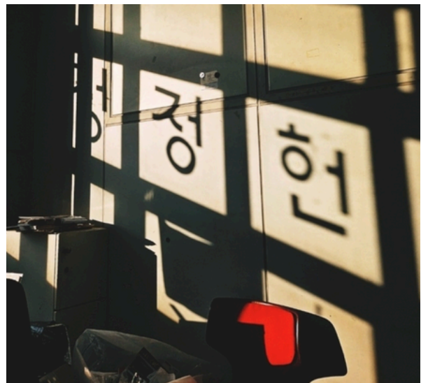
▲ 정정헌 동아리방 내부 모습